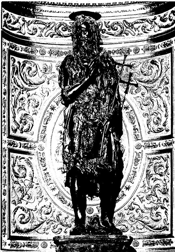
(図6) ドナテッロ 《洗礼者聖ヨハネ》