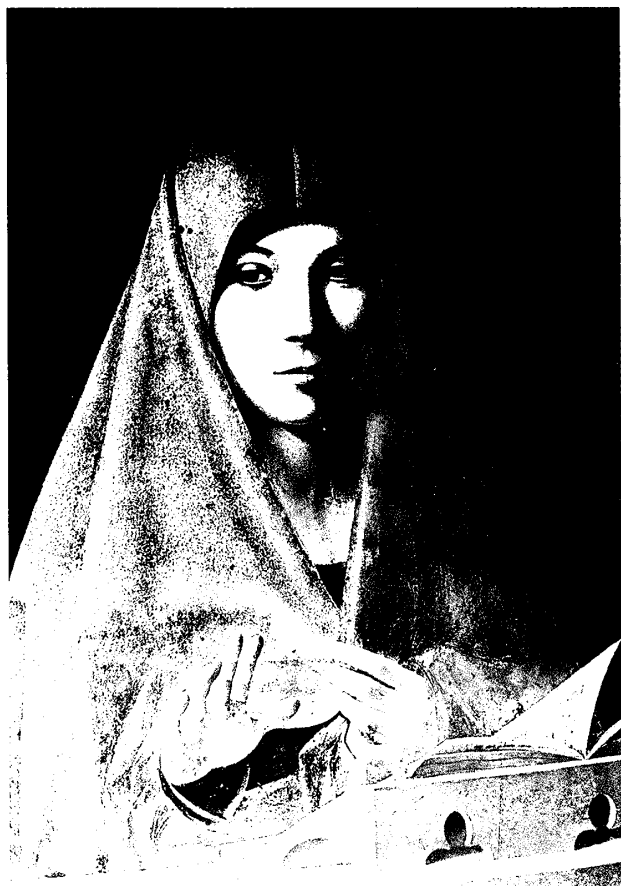
(図3) アントネッロ・ダ・メッシーナ 《受胎告知の聖母》