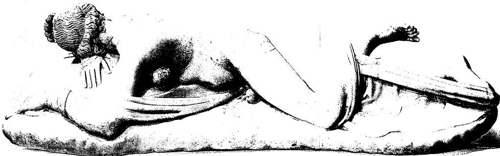
(図10) 帝政ローマ時代の模刻 《眠るヘルマフロディテ》