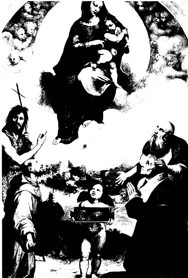
(図7) ラファエッロ 《フォーリーニョの聖母》(部分)