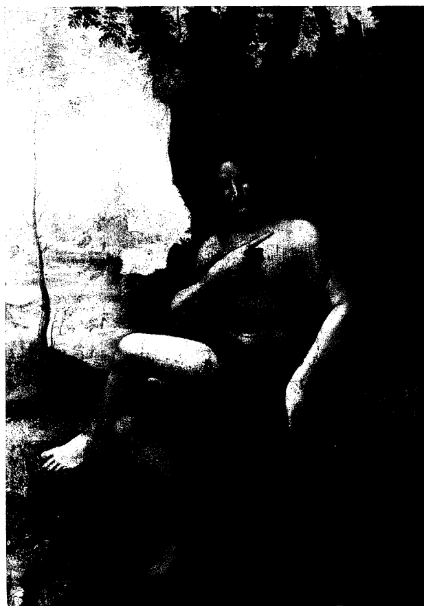
(図4) チェーザレ・ダ・セスト (?) 《バッコス》