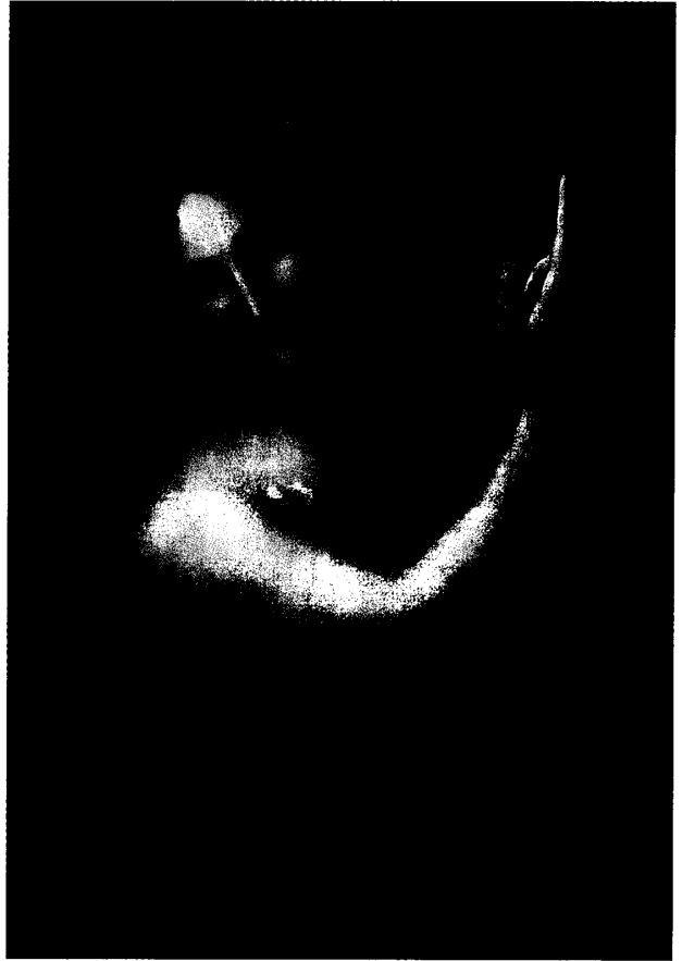
(図1) レオナルド・ダ・ヴィンチ 《洗礼者聖ヨハネ》