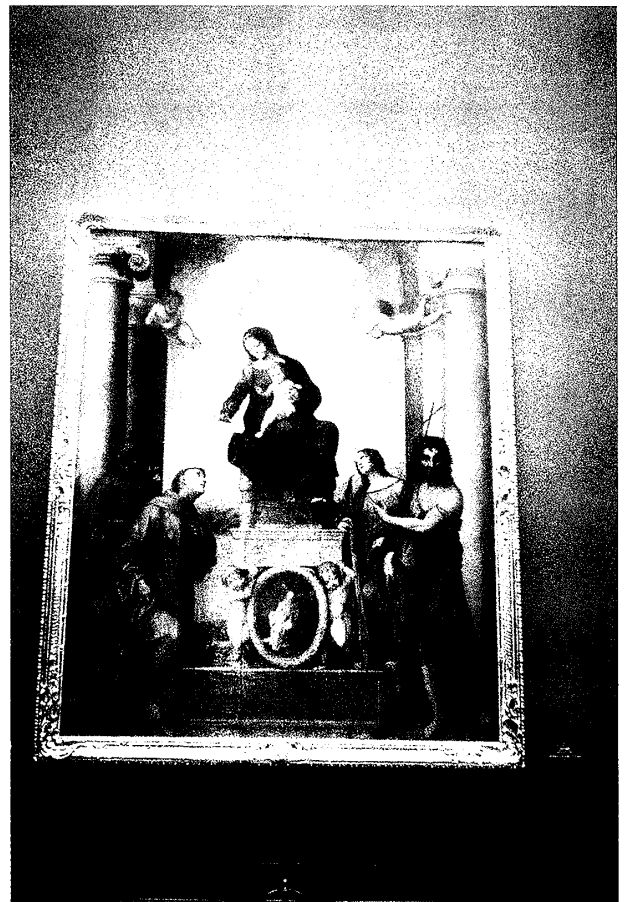
(図8) コレッジョ 《聖フランチェスコの聖母》