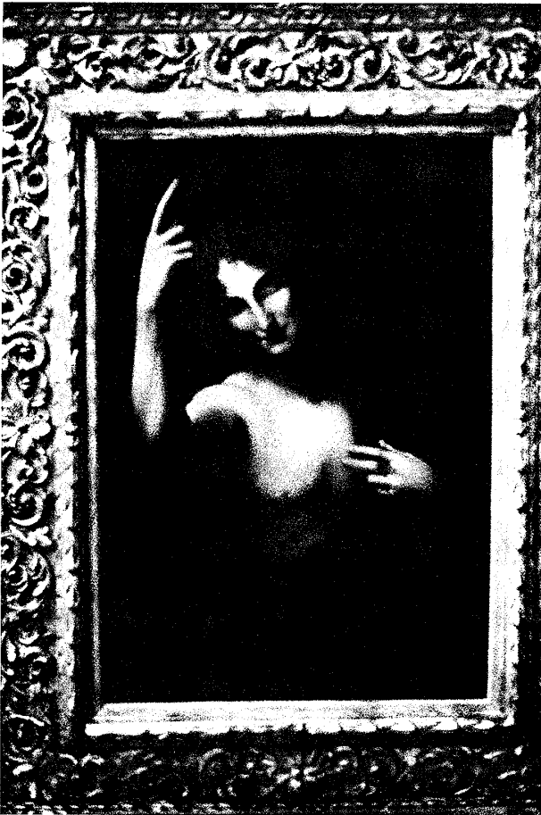
(図2) レオナルド派 《洗礼者聖ヨハネ》