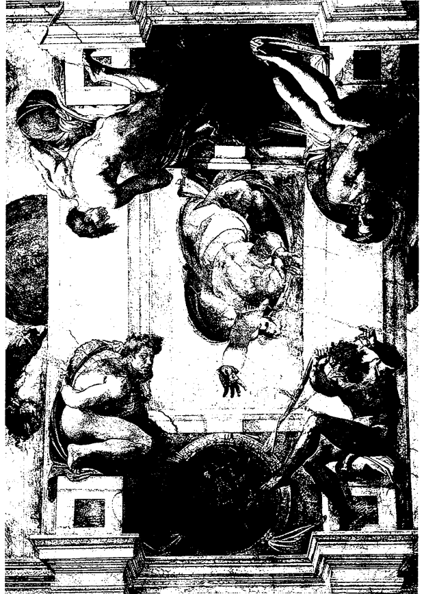
(図5) ミケランジェロ 《空と水の分離》 と裸体青年像