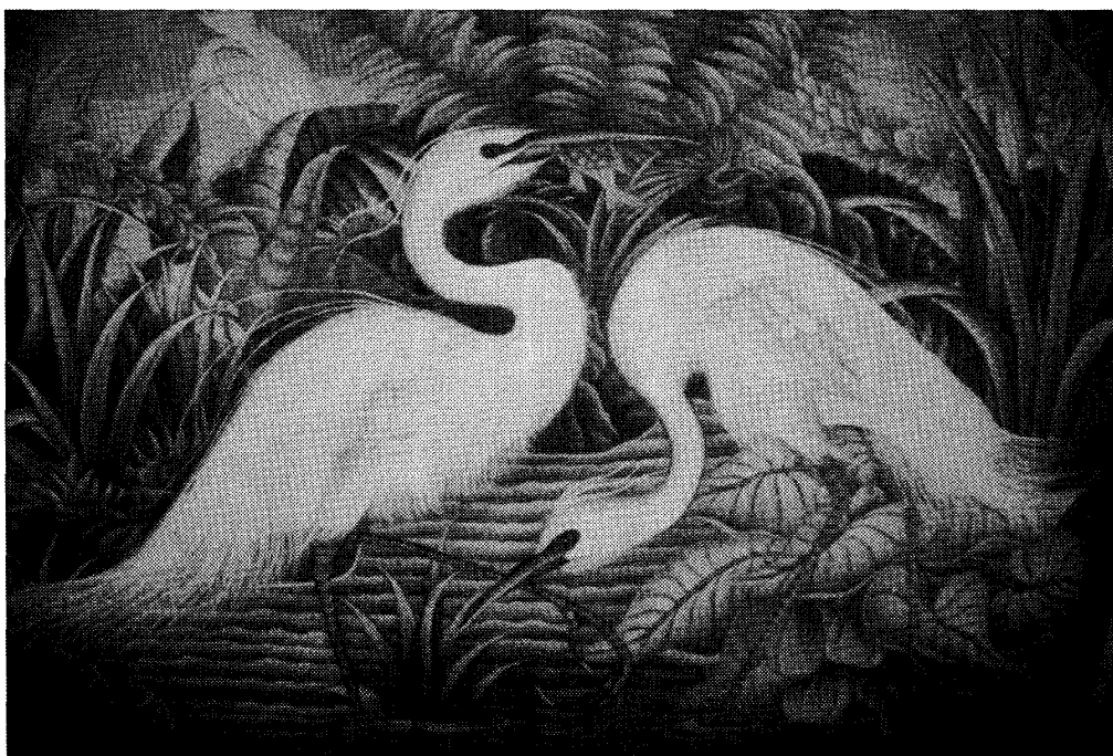
写真4 美術高校のギャラリーに飾られた生徒の絵画。ギャラリーは、生徒たちが絵を描く工房でもある。世界中から来た旅人と会話をし、共に絵を描く光景も見られる。平均月収が約5000円ほどのインドネシアで学資を得るのは時に困難が伴う。生徒は数百円から数千円で絵画を販売し、画材や学費を得ることができる。しかし、経済危機やテロ事件以降、訪問客は減少した。