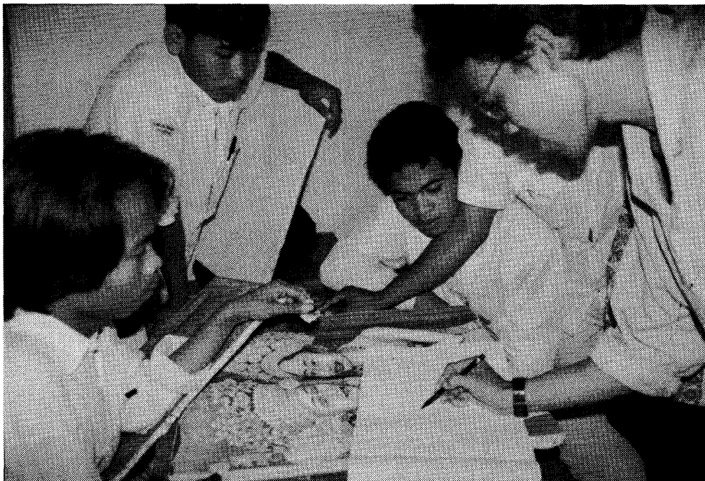
写真3 1994年当時の美術高校の授業風景。生徒たちは、教員の指先を真剣にみつめる。