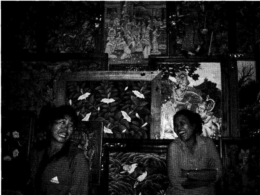
写真6 スカワティの芸術市場。画家達は，地域の市場や工房やギャラリーや美術館などで絵画を販売する。地域に根付いた市場や工房で絵を売り，学費と画材を得て大学まで進学した学生も珍しくない。芸術市場では，女性が商うケースが多い。2002年8月撮影。