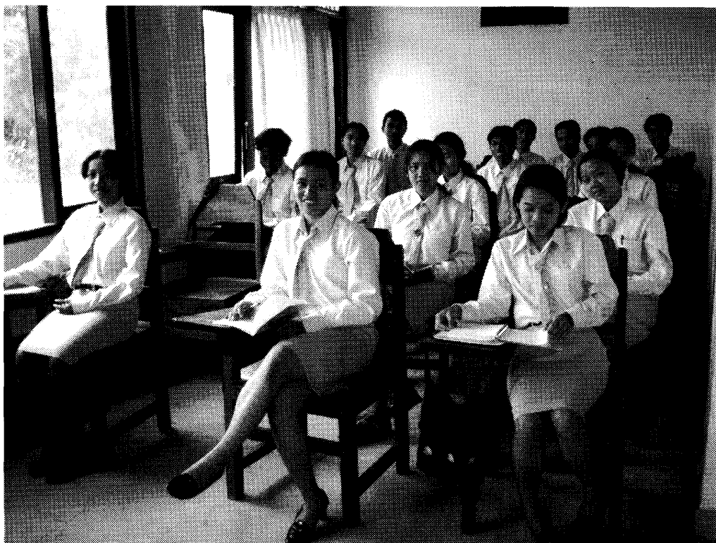
写真7 美術高校の敷地内に設立された観光学校の生徒達。2002年9月、新学期の風景である。1年かけて接客や掃除や料理の仕方なども学ぶ。元来は美術高校の教室であった場所を使用している。美術高校の生徒たちは教室を自由に使用することができず、現在は小さな教室を使用している。