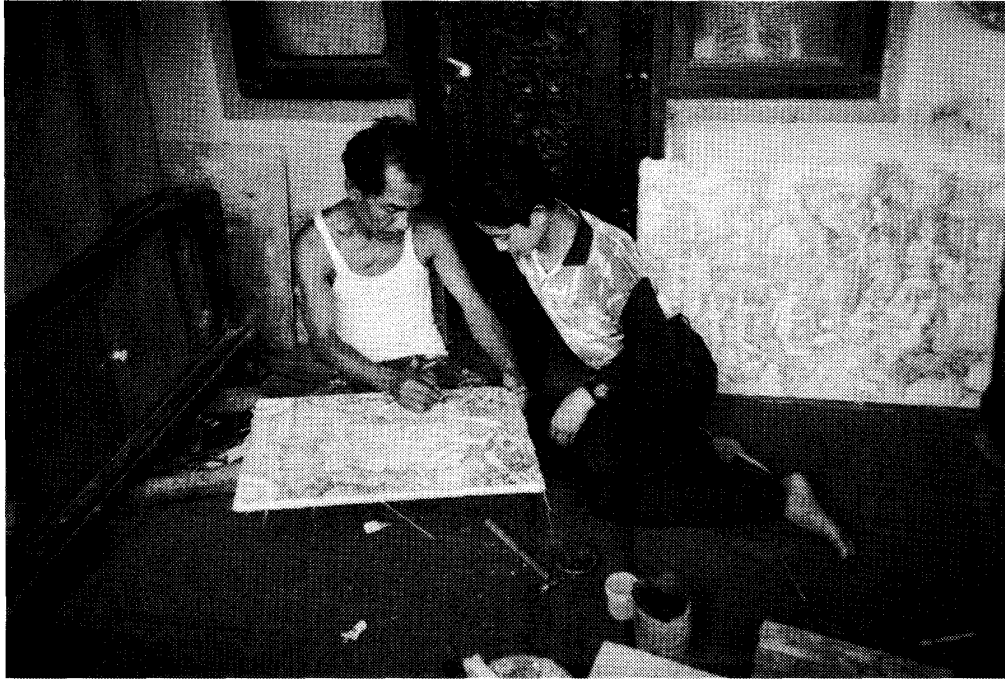
写真5 1994年頃，地域の工房に派遣された生徒と親方。自宅の縁側的空間が工房として使われている。壁には絵が飾られている。