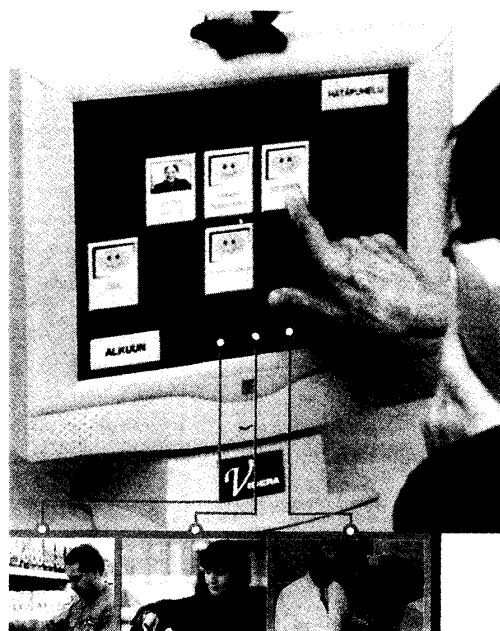
写真4. マルチメディア在宅支援コミュニケーション・システム

マルチメディア在宅支援コミュニケーション・システム (Multimedia Home Aid Communication System) は Oulu Deaconess Institute Hospital と地元の情報企業との間で共同開発中のシステムである。Deaconess Institute Hospital は研究機関をもつ総合病院で、あるユニットでは“Hospital-at-Home”という患者が病院ではなく自宅で‘入院’する、つまり、患者は自宅にいながらにして医者の監督のもと24時間メディカルケアを受けることができる体制を作り実施している。いま実験中のマルチメディア在宅支援コミュニケーション・システムは、写真(写真4)の通り、高齢者がタッチパネルに触れるだけで general practitioner やホームヘルパー、或いは、スーパーの店員とコミュニケーションすることのできるシステムである。現在、高齢者にこのシステムを実際に使用してもらい、そこから得られた情報をもとにシステムの再デザインを行っている。これまでに出てきた問題としては、例えば、使用者のニーズは当然のことながら一定ではなく多岐にわたるが、それらをどのようにカテゴライズしたら最大公約数のニーズに対応できるのか、高齢者側から見るとパネル上のどの表示を押せば自分のニーズがかなうのかが分かりにくい等々が指摘されている。デザイナー側とユーザー側の接点を見いだすには、ユーザーである高齢者の生活実態に関するエスノグラフィック(生き生きと詳細に描くの意)な調査が必要であろう。すでに持っている情報技術で何ができるか、何が作れるかということだけが先行すると実際には機能しないシステムが出来上がってしまう。“the beautiful logic and practical accomplishment” (Rooksby, J., Clarke, K., & Slack, R. 2004) の間を埋めるのは“使用者”に関する詳細な調査しかないのではないだろうか。