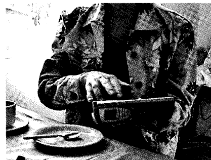
写真3. 実験的にモバイル機器でケアサポートセンターに高齢者のケア情報を送っている

一方、オウル市では、病院、ヘルスケアセンター、ホームケアセンター間のコミュニケーション・ネットワークを構築する際に、その有効なツールとしてEPRシステムを組み込むことを計画している。フィンランドの医療システムは日本とは全く異なり、病気になったとき人々は直接病院に行くことはしない。まず各地区のヘルスケアセンターに所属するgeneral practitionerの診断を受ける。全ての住民はその地区の特定のgeneral practitionerの患者として登録されている。オウル市の場合、全地区合わせて60名のgeneral practitionerがおり、それぞれ約2000人の住民のヘルスケアを担当している。高齢者の場合も例外ではない。この医療体制が、病院とヘルスケアセンターとホームケアセンター間のコミュニケーションを促進させる基盤になっている。3者間を結ぶICT（Information & Communication Technology）ネットワーク・プロジェクトは、病院のドクターによる治療記録とヘルスケアセンターのEPRシステム、そして、ホームケアセンターのケアレポートをオンラインに組み込み、医者、general practitioner、看護師、訪問看護師、ホームヘルパー、場合によっては高齢者の親族といった各グループが必要に応じてデータを相互参照し、高齢者のケアを連携して行おうとする試みである。2003年にはこのICTネットワークにモバイル技術を導入するプロジェクトも立ち上げられている（写真3）。ホームヘルパーや訪問看護師がケアの現場を離れることなく直接必要な情報にアクセスしたり、新たな情報を送付したり、また、general practitioner、看護師、他の訪問看護師やホームヘルパー、そして高齢者の家族などと情報交換できるシステムである。このシステムの本格的な導入を前に、オウル市では2003年秋からホームケア・スタッフ、看護師、general practitioner、ドクターを対象に2日間のトレーニングが開始された。このICTネットワーク・プロジェクトはまだ実験的試行の段階であるが、フィンランド特有の医療体制というしっかりしたインフラを組み込むかたちでデザインされているのでうまく機能する可能性は高いと考え