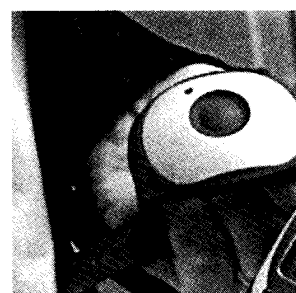
写真1. リストケアバンド

リストケア・システムは高齢者の腕に装着して体調をモニターし緊急時にはアラーム信号とデータを自動送信するブレスレット (リストケアバンドと呼ぶ) (写真1) とデータを受信し変化を監視するベースステーションから構成されている。送信する体調データは基本的には体動、微動、皮膚温度、皮膚導電率などであるが、ケアのレベルに応じてより細かなモニターが必要な場合には利用者の日常生活のリズム曲線であるアクティビティーカーブ (活動曲線) (写真2) を出力する。オウル市にある CARITAS ナーシングホームというかなり高額な有料老人ホームでは全入居者の